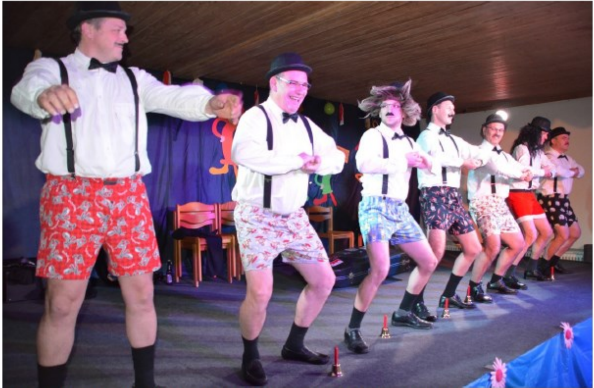
Mit zwei Einlagen zeigten die Fußballer der Alten Herren ihr Können.