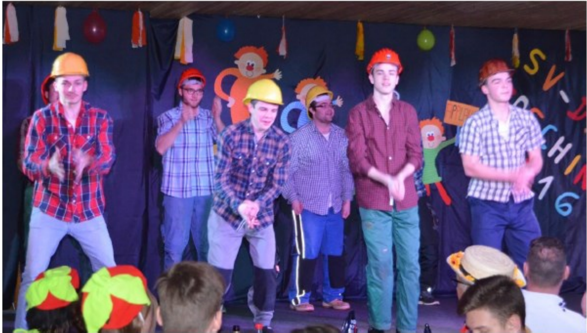
Mit einer souveränen Choreografie warteten die Jungs vom Männerballett auf.