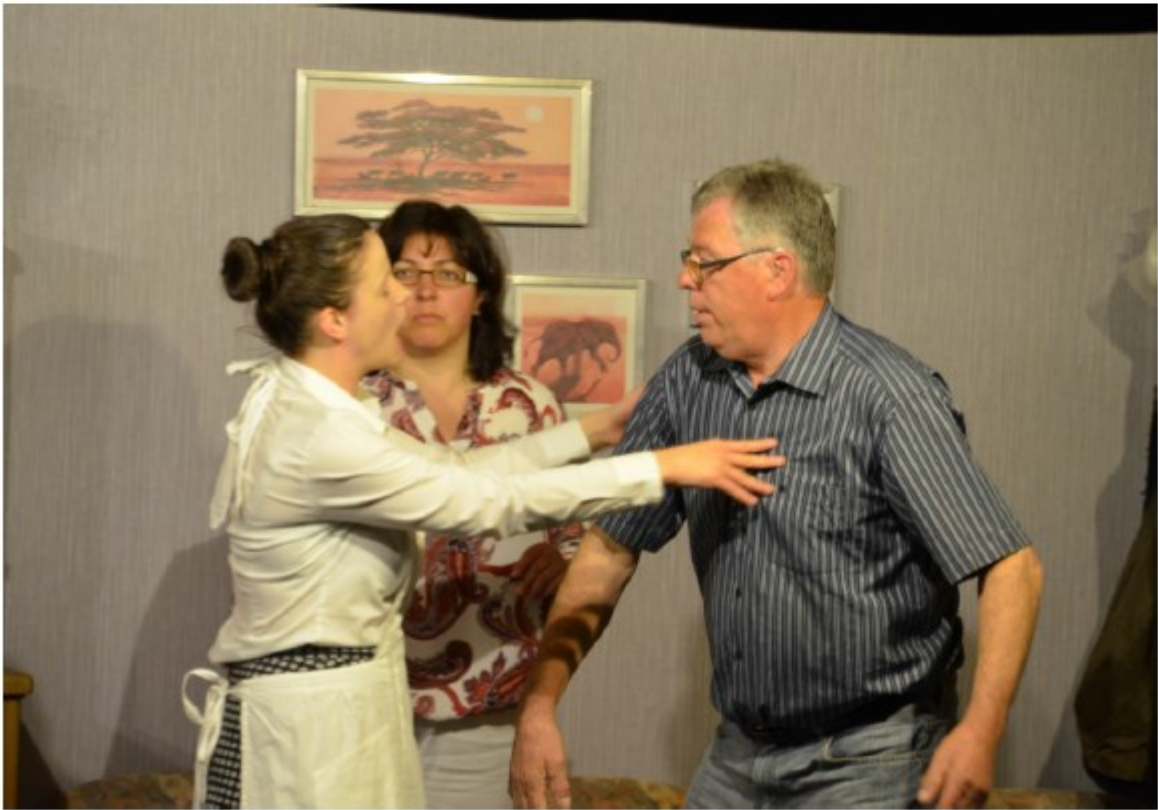
Jetzt pfuscht der Postschlepper auch noch dazwischen.