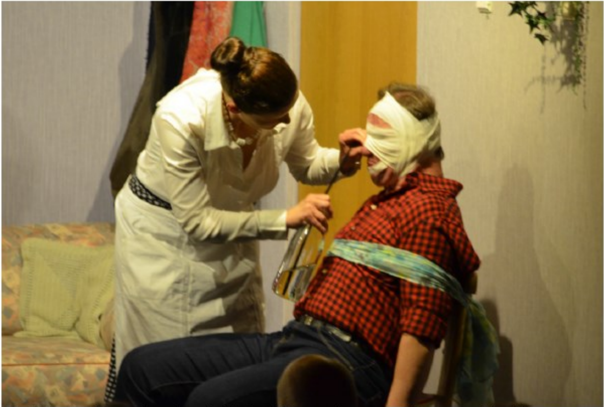
Medizin für Papa Joe, damit die Ami Marry das ganze Drama schluckt.