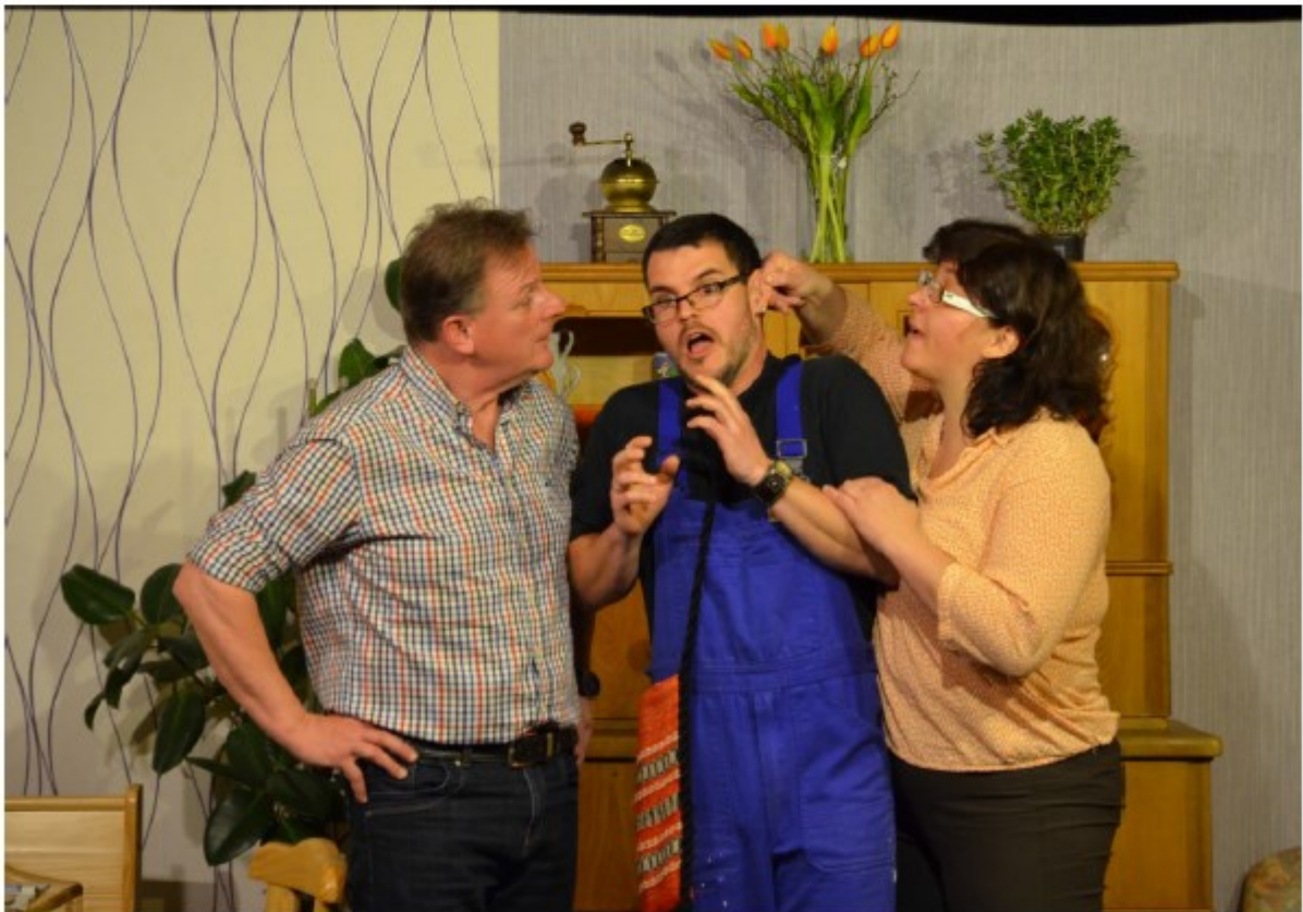
„Müsli Moritz, weißt Du was, was wir nicht wissen?“