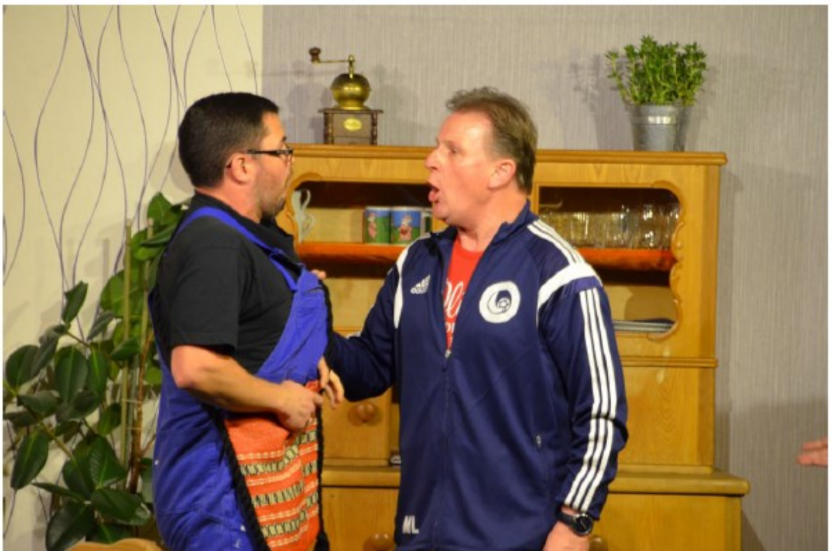
... da hat Papa Joe seine negativen Wellen nicht im Griff !