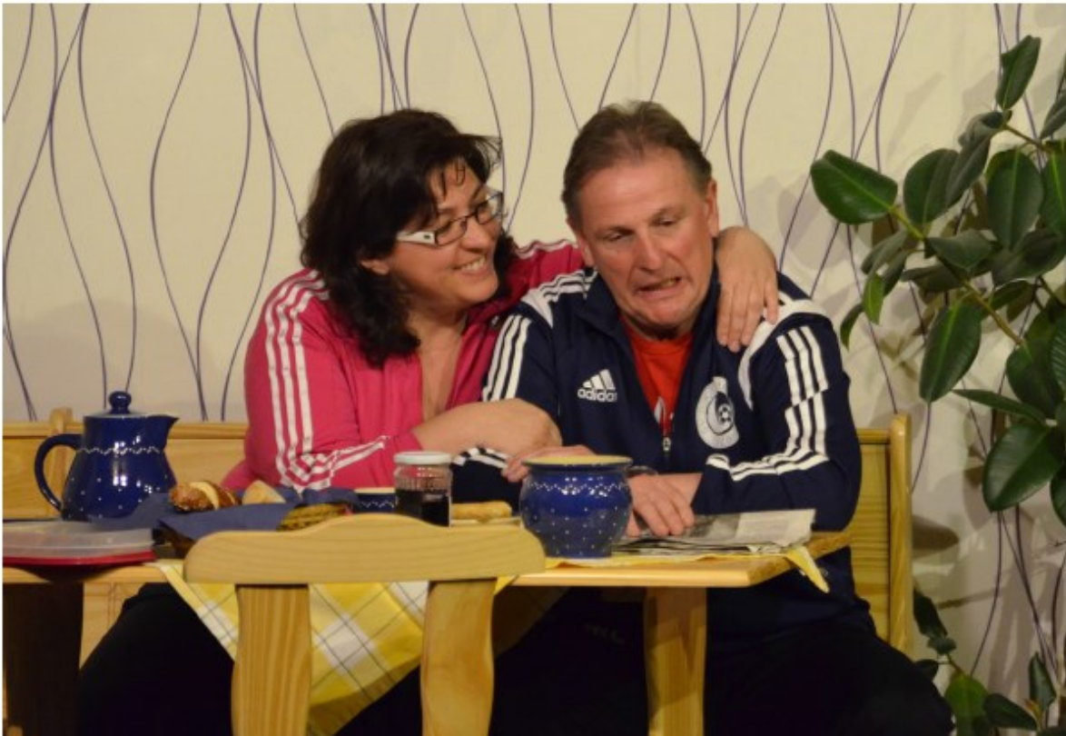
... die Aussichten stürmisch und tubulent!