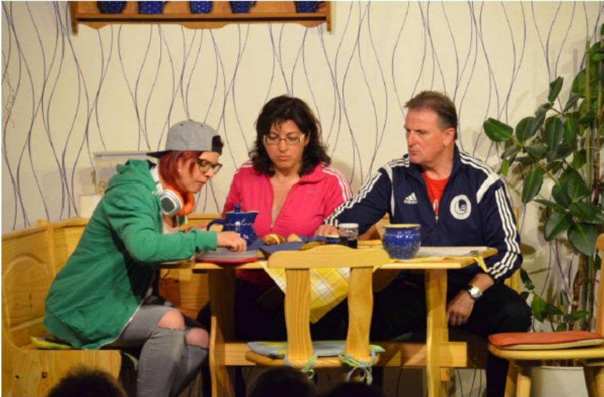
Erster Urlaubstag von Papa Joe ...