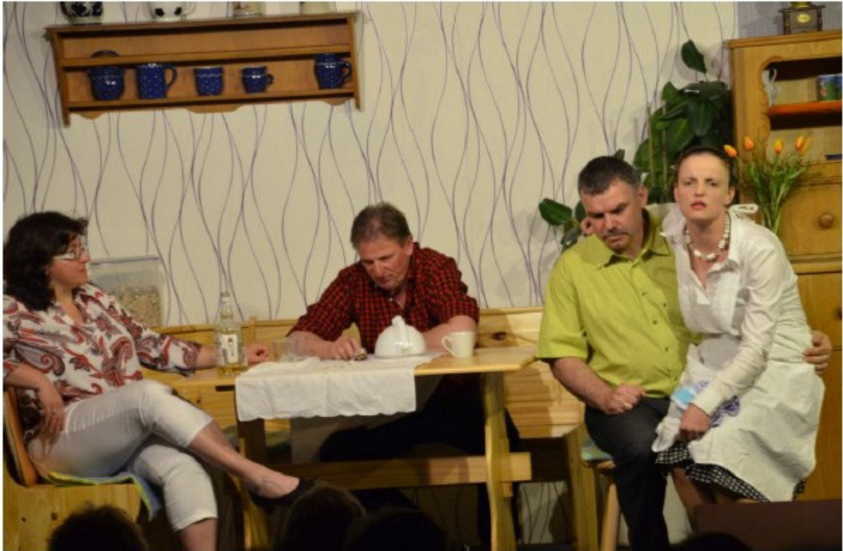
Kochen ist halt nicht jedermanns Sachel!