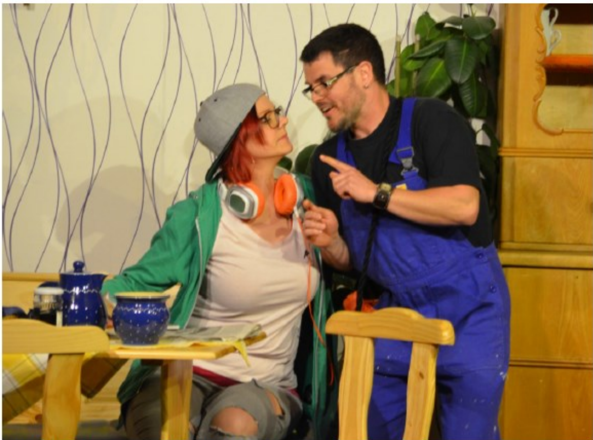
Du bist doch mein rotes Apfelbäckchen.